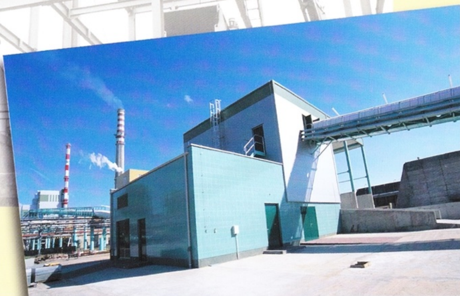
Budynek przesypowy kory