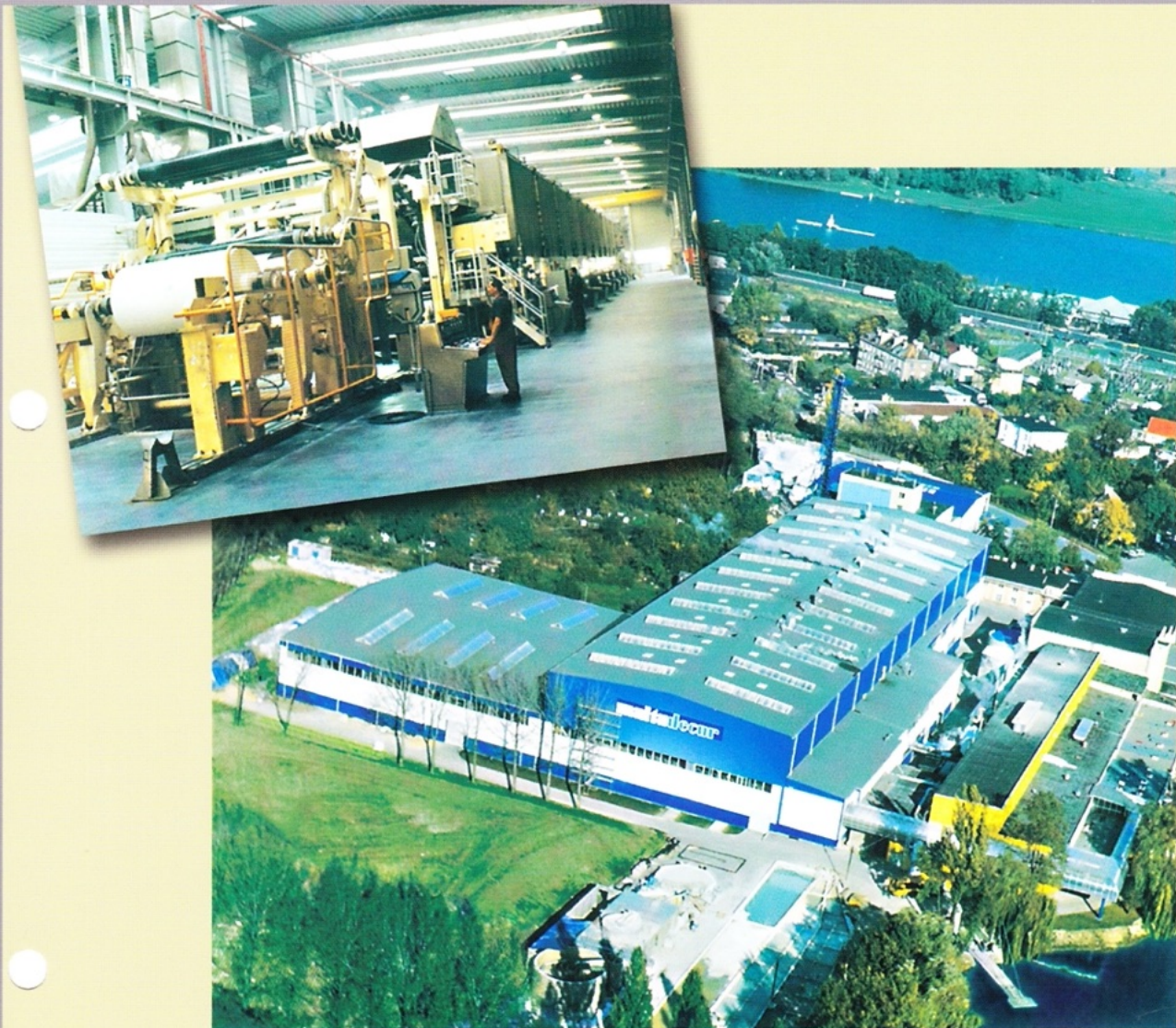
Fabryka Papieru "Maltadecor"