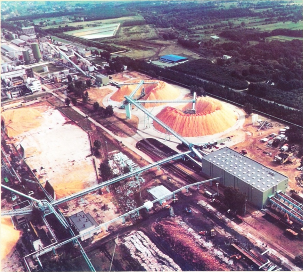
Frantschach Świecie - plac drzewny