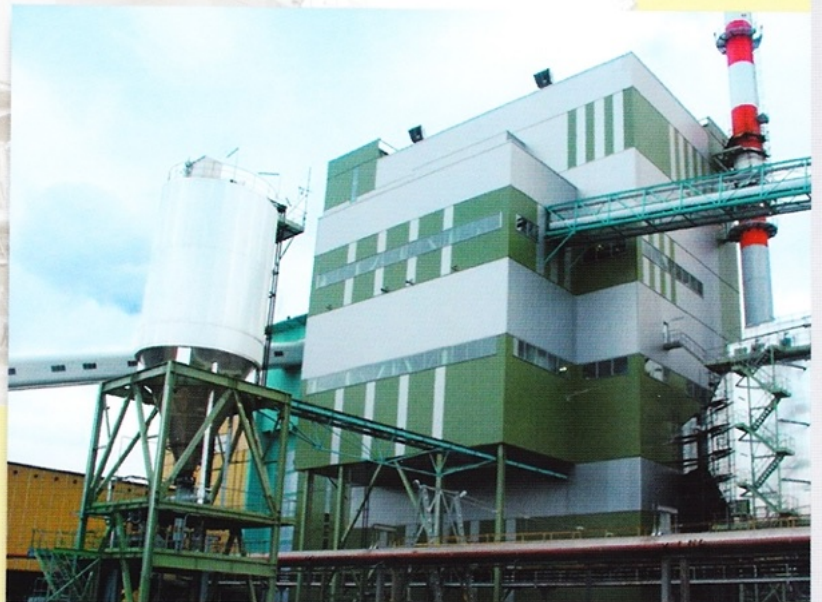
Obiekt kotła fluidalnego