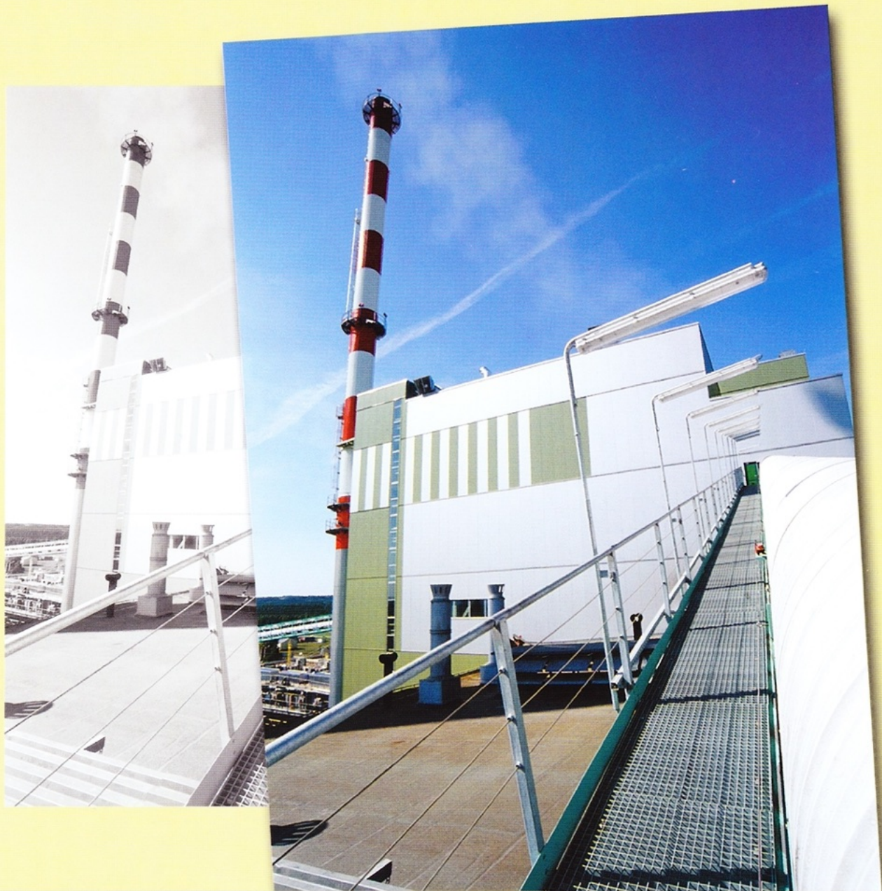
Estakada przenośnika węgla