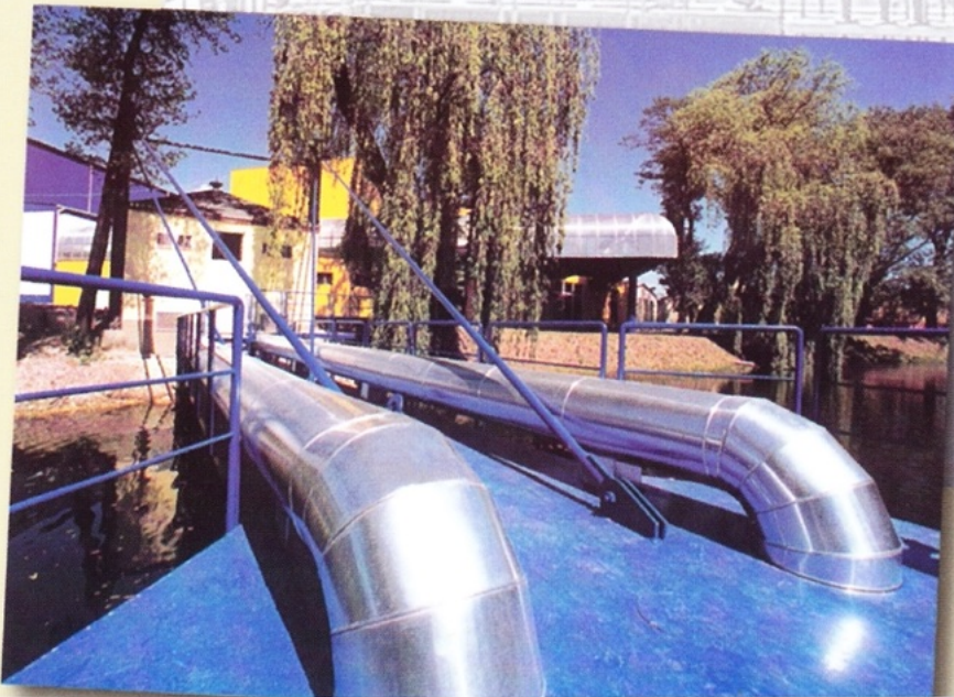
Fabryka Papieru "Maltadecor" - pomost stacji pomp p-poz.