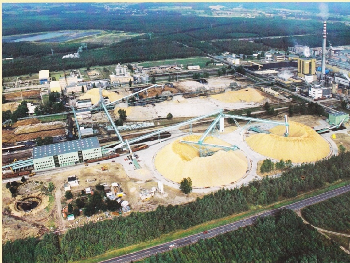
Frantschach Świecie - plac drzewny