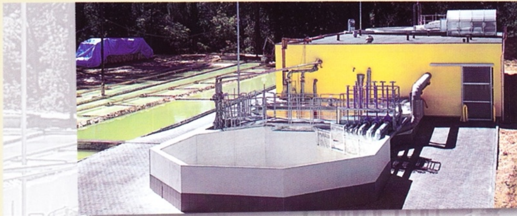
Fabryka Papieru "Maltadecor" - oczyszczalnia ścieków